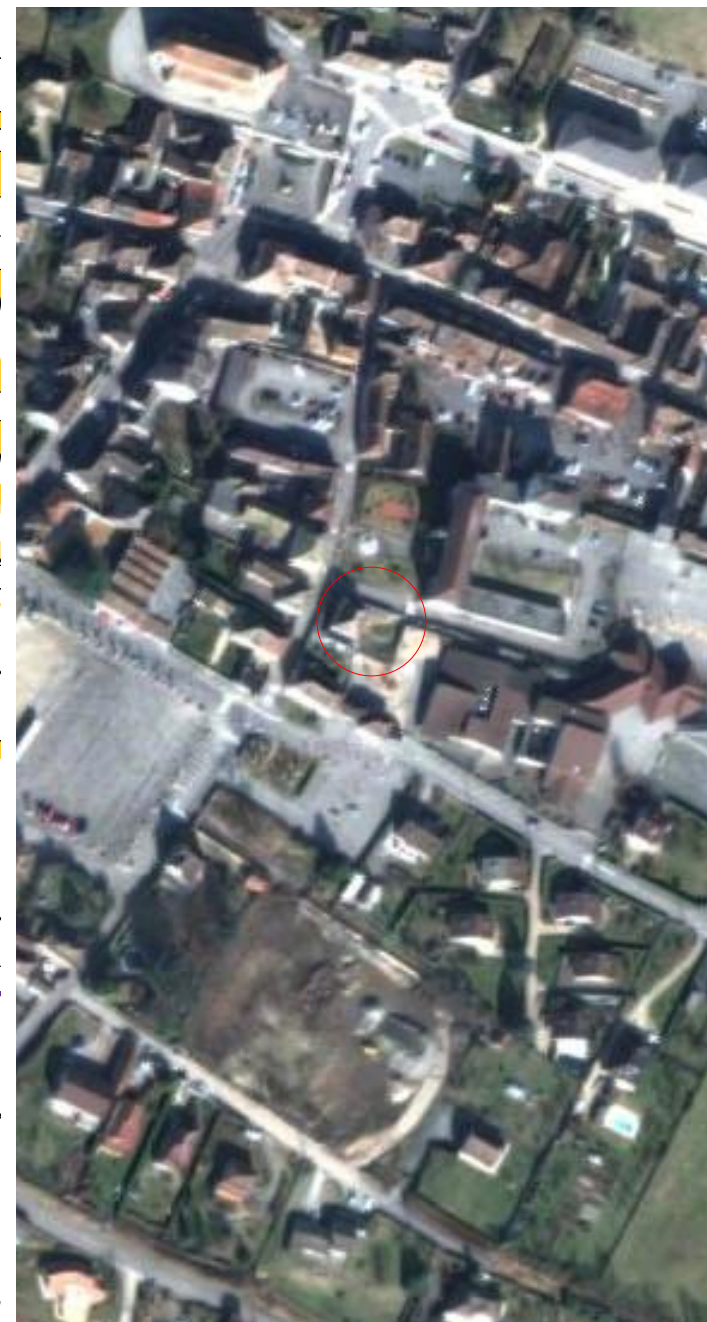
Plan de situation - sans échelle