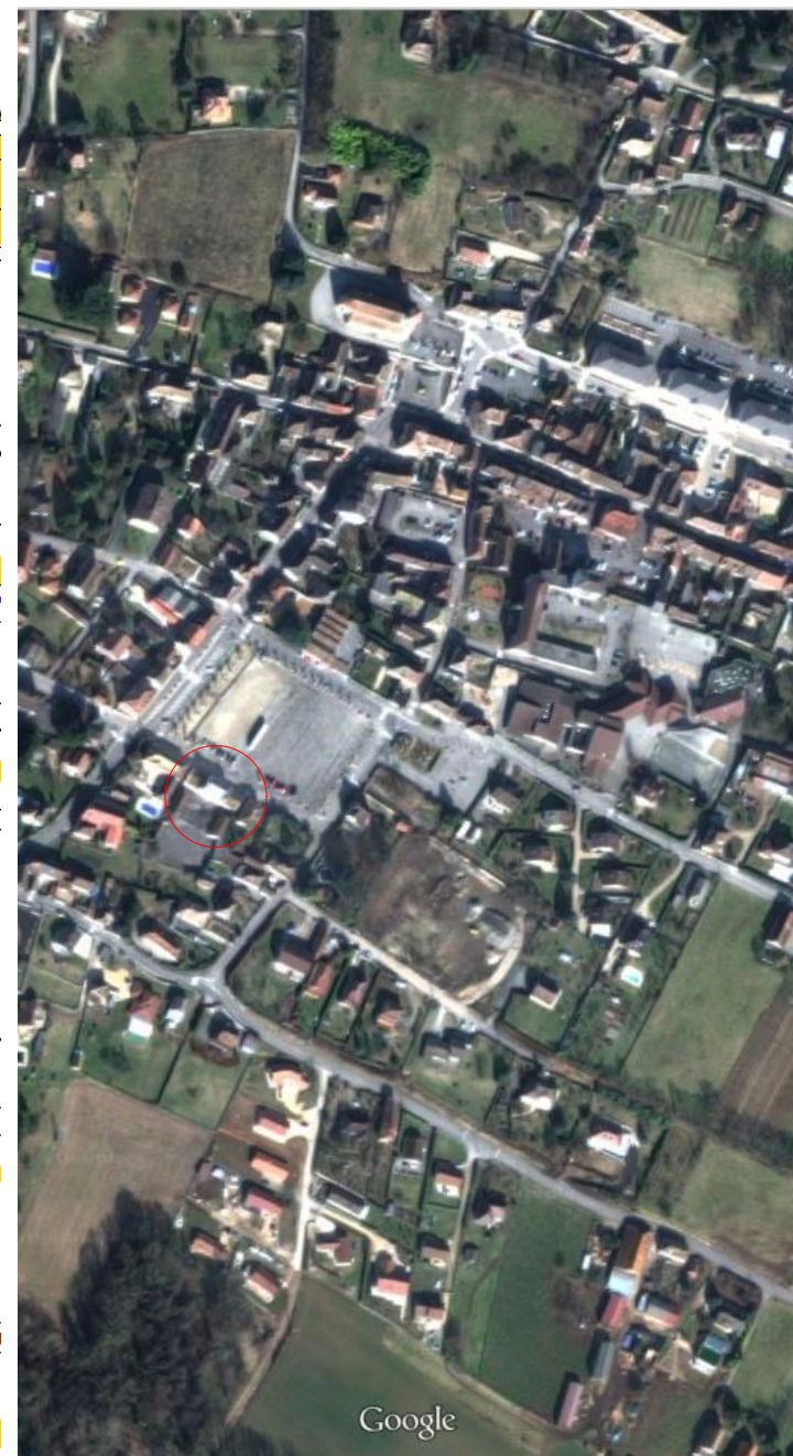
Plan de situation - sans échelle